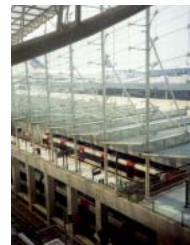
Roissy : Gare TGV - Aéroport CDG

Lieu d'élection de nombreuses sociétés étrangères, le Val d'Oise se révèle terre d'excellence pour l'implantation des entreprises et la création d'emplois. Ainsi, son avenir s'avère prometteur, d'autant que les acteurs locaux, publics et privés, savent se mobiliser ensemble pour son développement.