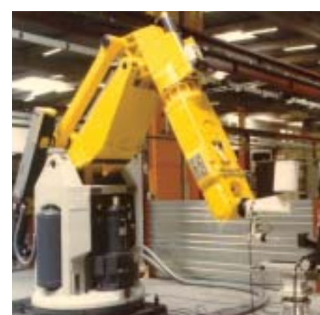
Entreprise de robotique

Celles-ci sont orientées, notamment, vers toute une