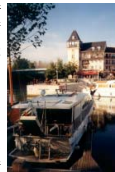
Marina de Port Cergy

L'Abbaye de Royaumont, en tant que Centre international de rencontres, accueille de plus en plus de séminaires organisés par de grandes entreprises, auxquels elle apporte la beauté et le prestige de son cadre. Ce « plus » culturel offert ainsi au monde économique est aussi le résultat d'une action de communication menée par le CEEVO et la Fondation Royamont, qui ont conçu ensemble un coffret de prestige - trois ouvrages et un CD musical - proposant une découverte du Val d'Oise et de l'Abbaye, à travers le regard de photographes et d'écrivains.