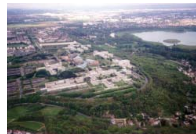
Le Parc Saint-Christophe à Cergy-Pontoise

Cet effort, lié à la volonté de tous les partenaires institutionnels et économiques, a permis l'implantation, en 1990, d'une Université de plein exercice aux compétences multiples, accueillant plus de vingt laboratoires de recherches, mais